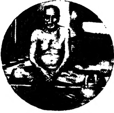
श्रीपरमपूज्य चारित्रचक्रवर्ति आचार्य शान्तिसागरजी महाराज.